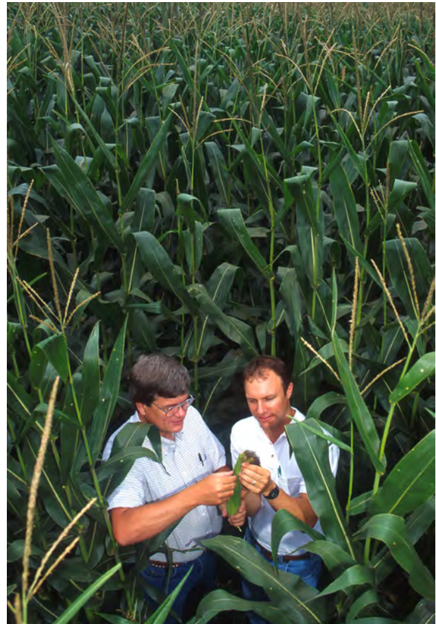
Forskarar i maisåker.

I versjonen av CP4 EPSPS som dei genmodifiserte plantane lagar, er rekkjefølgja av aminosyrer noko annleis enn i den