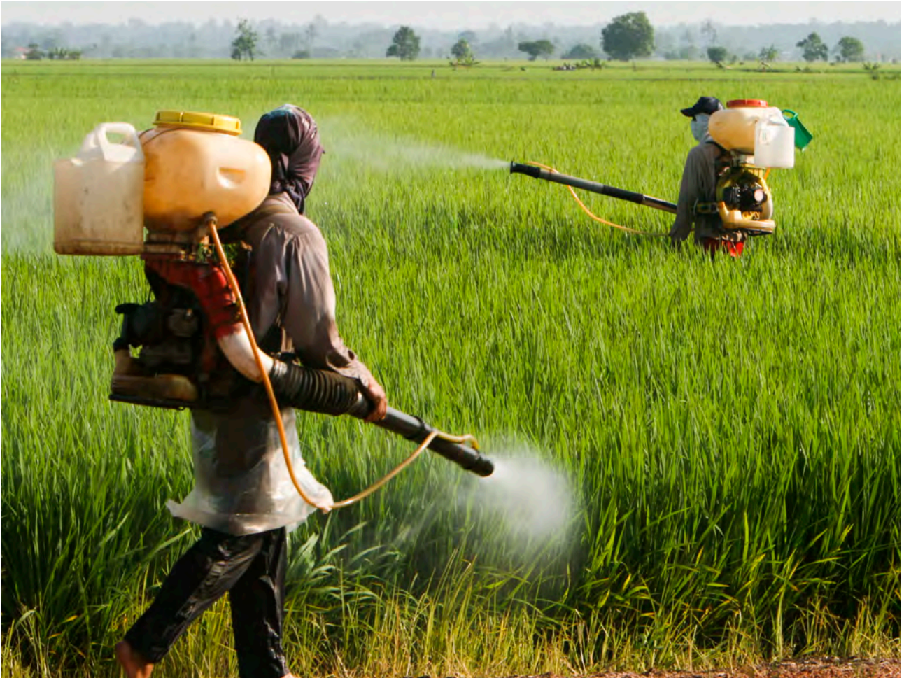
Risbønder i Sekinchan, Malaysia. Genmodifisert ris som er resistent mot sprøytemiddel, er utvikla, men ikkje teken i bruk enno.