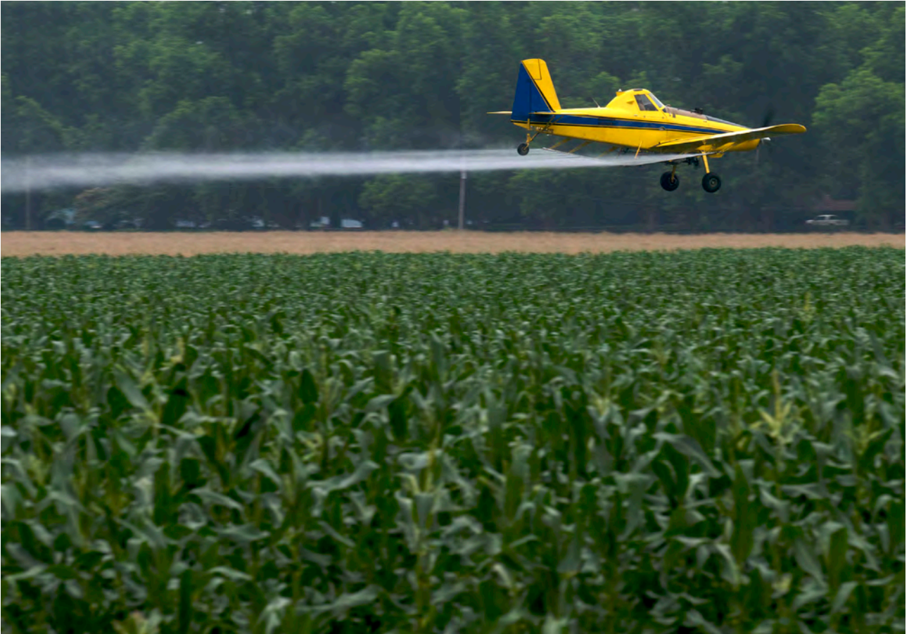
Sprøytemiddel som driv med vinden frå åkeren til nærområdet, er eit problem ved sprøyting frå fly.

nar. Slike tilsetjingsstoff kan ha biologiske verknader. Derfor meiner vi med sprøytemiddel ikkje berre den aktive ingrediensen, men heile produktet med emulgatorar, stabilisatorar og andre tilsetjingsstoff.