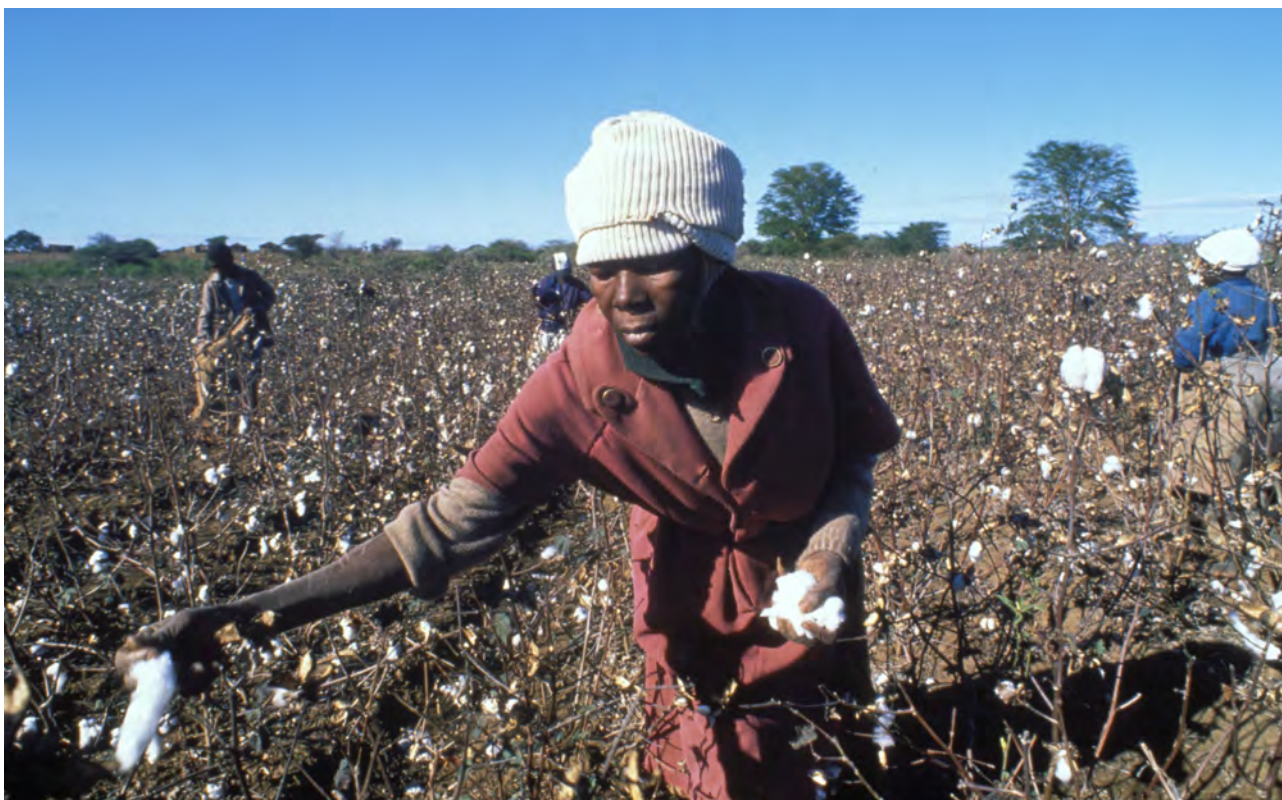
Plukking av bomull.

middel. Dei produserer først og fremst for lokale marknader og for sjølvberging. Produksjon til lokale og nasjonale marknader er viktig mellom anna fordi det kan truge matsikkerheita om eit land blir for avhengig av import.