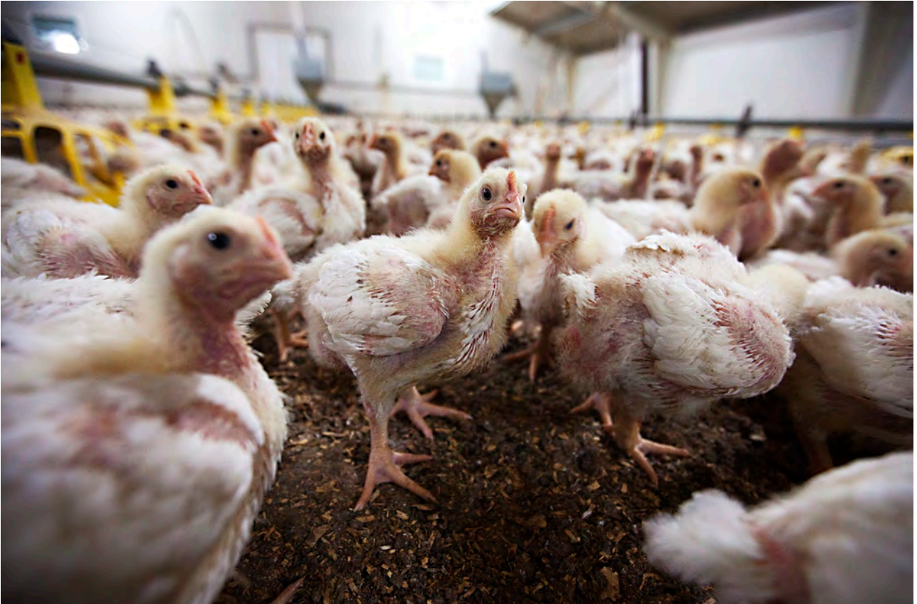
Kyllingproduksjon på Høylandet i Nord-Trøndelag.