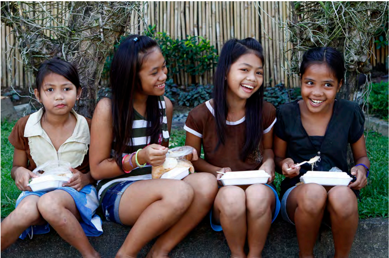
At alle menneske har tilgang på nok, trygg og næringsrik mat, bidreg til berekraftig utvikling. Frå Filippinane.