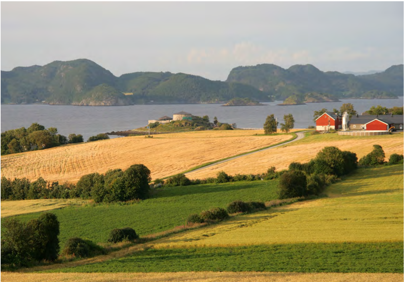
Norsk landskap. Trondheimsfjorden.