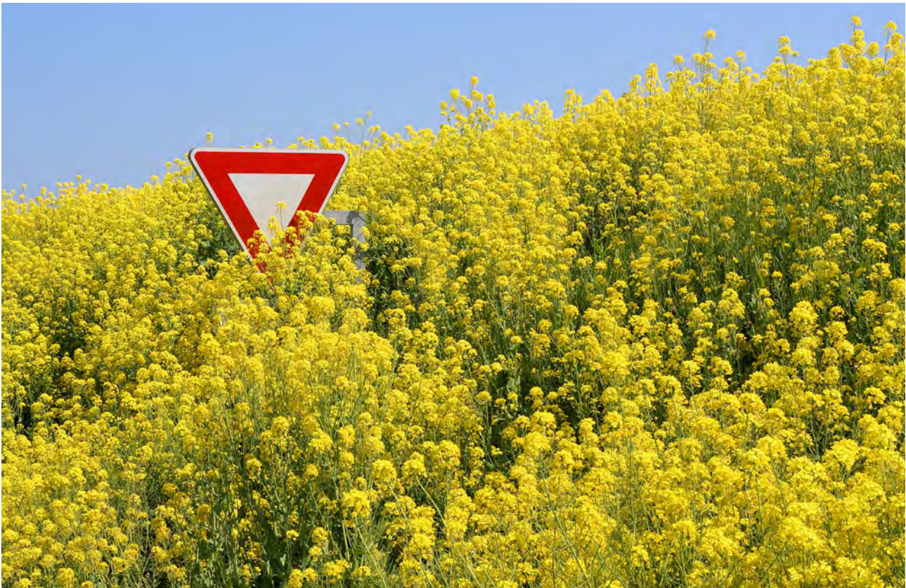
Rapsplantar som har spreidd seg, Frankrike.

Viss den genmodifiserte planten er ein hybrid (sjå kapittel 4.3.4.2), er det derimot ikkje like aktuelt for bøndene å ta vare på såfrø.