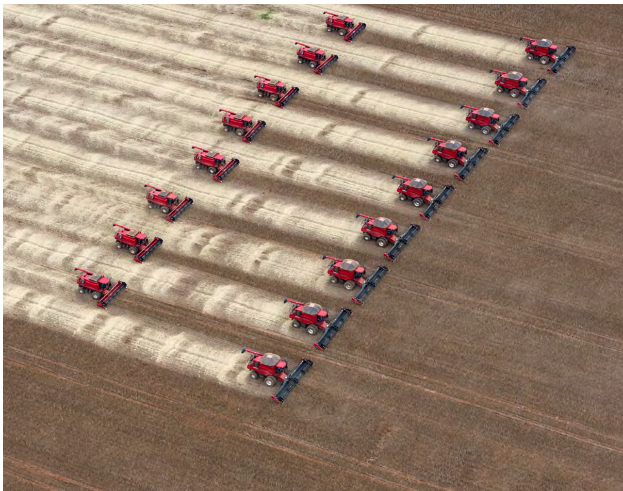
Storskalajordbruk. Soyahausting i Brasil.

mål som dei som søker om godkjenning av ein HR-vekst til import eller dyrking, bør svare på. Tabell 3 inneheld spørsmål som norske styresmakter, og ikkje søkjaren, bør svare på når dei skal gi ei heilskapleg vurdering av søknaden.