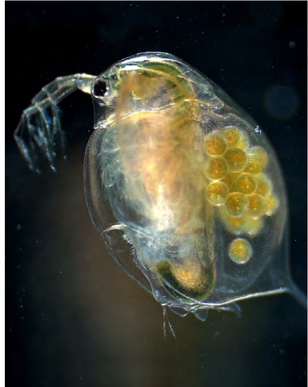
Vasslopper ( Daphnia magna ) er eit døme på ferskvassorganismar som kan bli skadde av sprøytemiddel som glyfosat og glufosinat.

Mekanismane som gjer at 2,4-D påverkar ikkje-målorganismar, er ikkje fullstendig kartlagde. 2,4-D hemmar fleire enzym som er viktige for korleis cellene reagerer på stress. Når desse enzyma ikkje fungerer, blir celleoverflata svekt, slik at andre stoff enn vanleg kan fraktast inn i og ut av cellene. Nokre forskingsresultat tyder på at 2,4-D kan