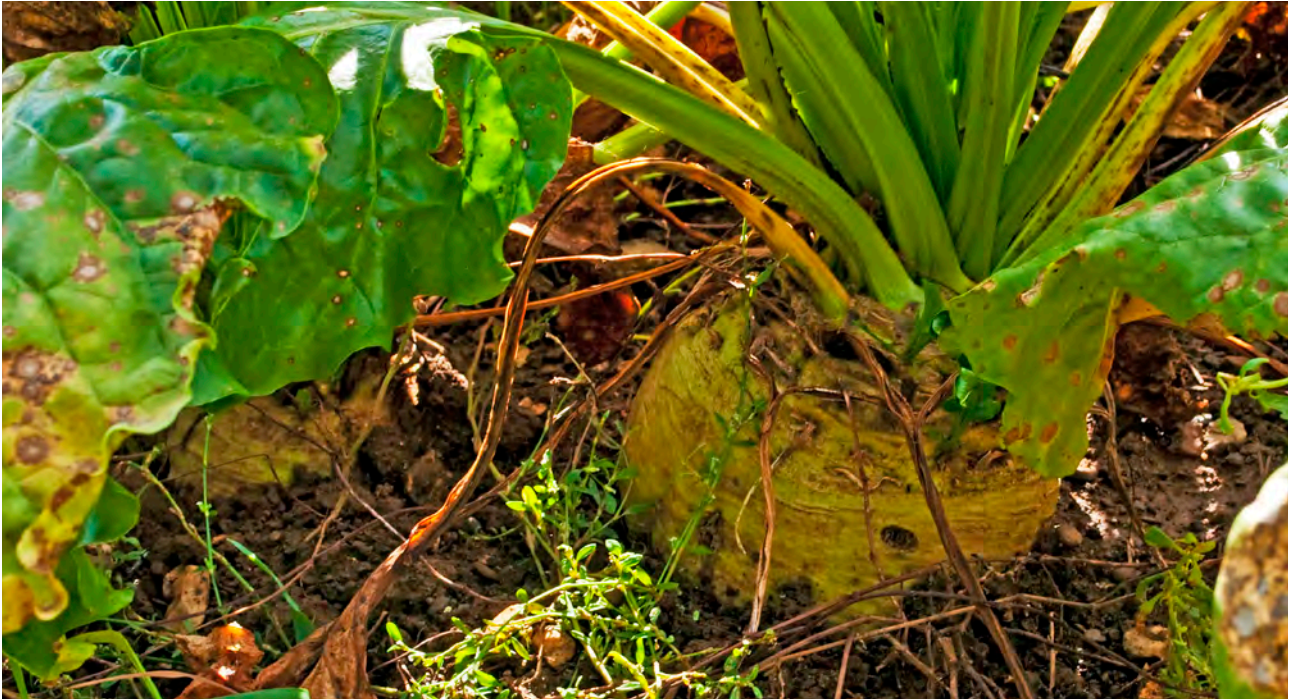
HR-sukkerbete blir dyrka i Nord-Amerika.

å ta hand om, eller som det er rimeleg å forvente at ein søkjar skal svare på. For det andre risikerer ein, når ein deler inn i miljømessig, økonomisk og samfunnsmessig berekraft og deretter bryt berekraftomgrepet ned til ei rekkje enkeltspørsmål, å miste den heilskaplege tilnærminga som er ein del av kjernen i omgrepet. Til dømes kan konsekvensane av å godkjenne mange genmodifiserte organismar bli annleis enn om ein godkjenner nokre få. Dette må styresmaktene ta ansvaret for å vurdere. I tillegg må styresmaktene vurdere dokumentasjonen frå søkjarane og samanlikne med annan tilgjengeleg dokumentasjon.