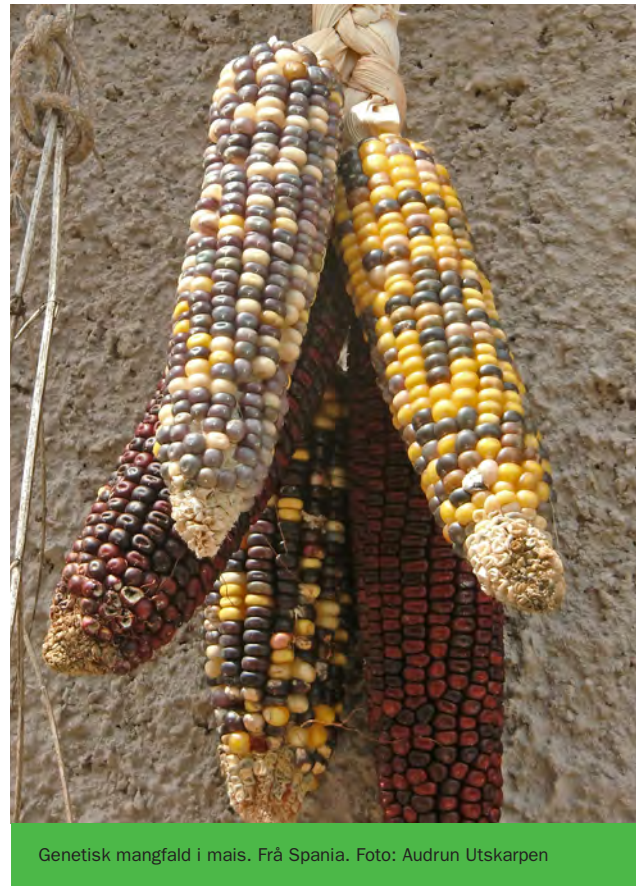
Genetisk mangfald i mais. Frå Spania.

Patentvernet for levande organismar er dei siste tiåra vorte sterkare og meir utvida. Patent gjer det ofte forbode eller dyrt å ta vare på, byte eller selje såfrø frå eiga avling, og kan òg hindre kommersialisering av nye sortar når foredling er lov (sjå òg kapitla 4.3.5 og 4.6.3). Samstundes er det enklare å oppfylle patentkriteria og å kontrollere brot på patentet for ein genmodifisert plante enn for andre plantar. Slik har det vorte ein gjensidig forsterkande effekt mellom patentpraksis og genteknologi, som har bidrege til marknads-konsentrasjonen. Denne utviklinga kan ha mykje å seie for framtidige val innan mat og ernæring, ikkje berre for bøndene, men for heile samfunnet.