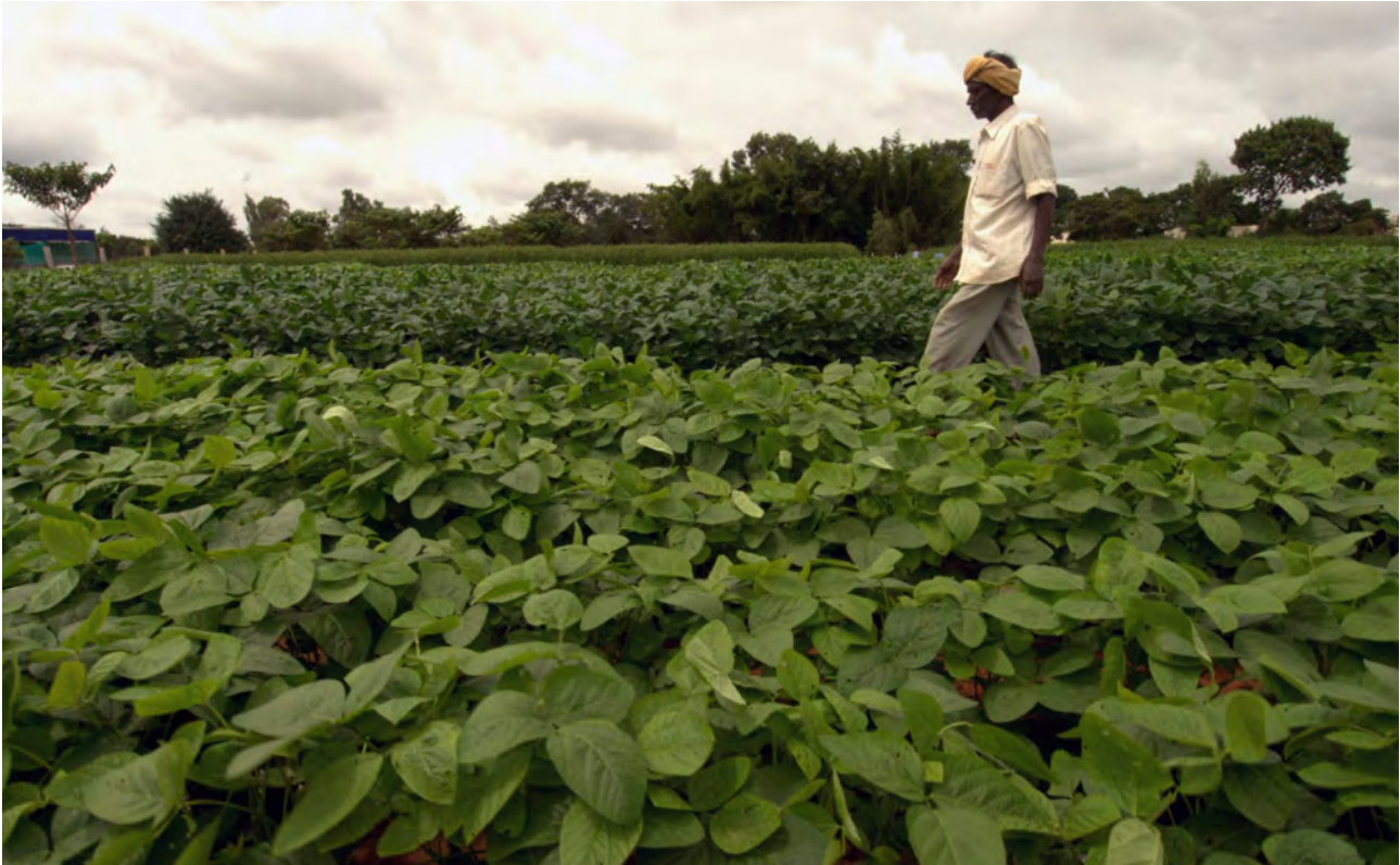
Soyaplantasje. Bangalore, India.