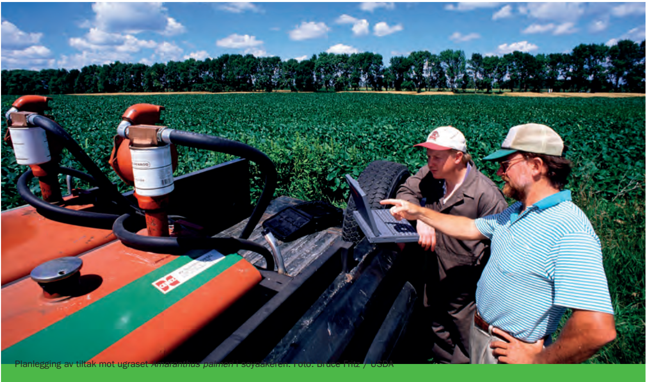
Planlegging av tiltak mot ugraset Amaranthus palmeri i soyaakeren.